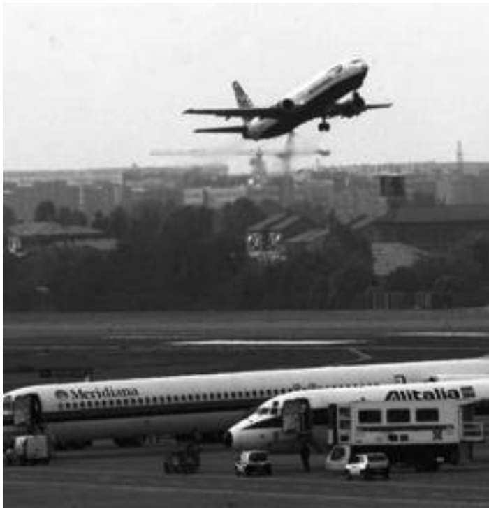
Un velivolo decolla dall'aeroporto di Linate: l'inquinamento acustico non è risolto