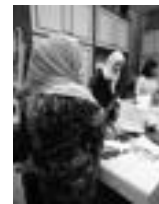
Un appello dal Cav

puerpere, prevedono anche supporti mirati nei primi mesi di vita del bambino, affinché le mamme possano lavorare e avere a disposizione i beni essenziali per sé e per il neonato. Proprio nei mesi scorsi si era alzato un appello dal Cav, con la richiesta di aiuto rivolta a singoli cittadini e ad altre realtà locali, a fronte della necessità sia di volontari, ma anche di sostegni economici. Tra le risposte che sono arrivate, c'è questo torneo dai nobili obiettivi. Oltre infatti a tenere allenati impiegati e professionisti che dopo il lavoro di scrivania nel palazzo di vetro si cimenteranno in sfide promesse in pieno clima sportivo, il torneo rappresenta una mano tesa verso un importan-